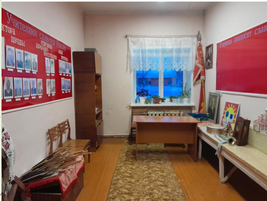
Музей. ДО ремонта