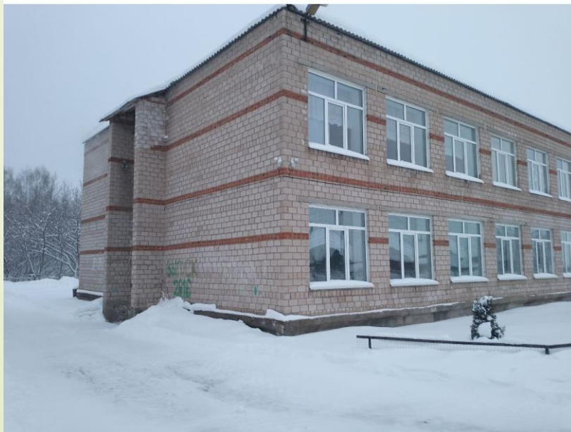
Фасад здания. ДО ремонта