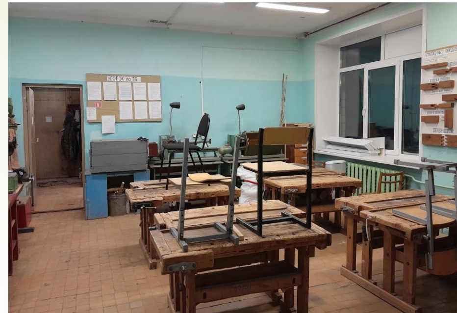
Мастерская технологии для мальчиков. ДО ремонта