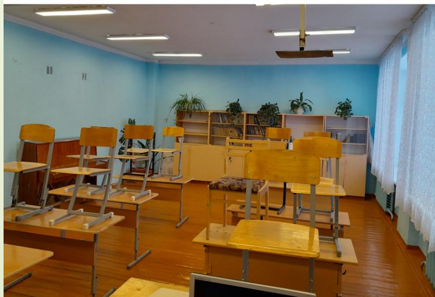
Кабинет математики. ДО ремонта