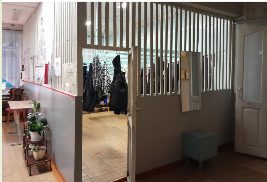
Раздевалка. ДО ремонта