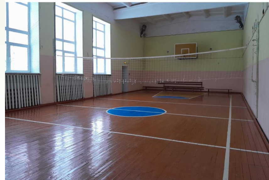
Спортивный зал. ДО ремонта