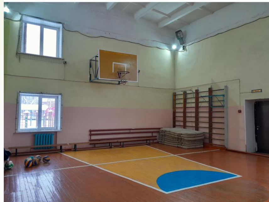
Спортивный зал. ДО ремонта