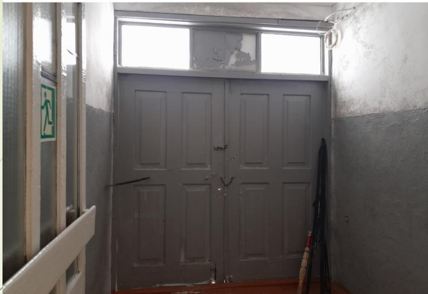
Центральный вход. ДО ремонта