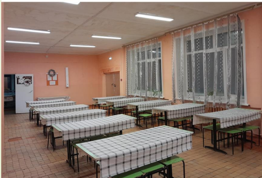
Столовая. ДО ремонта